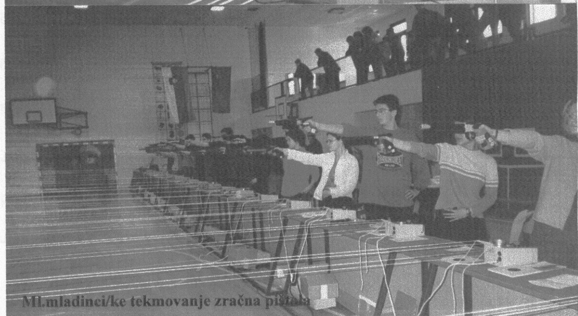
Ml.mladinci/ke tekmovanje zračna pištola