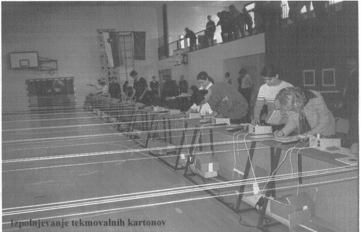
Izpolnjevanje tekmovalnih kartonov