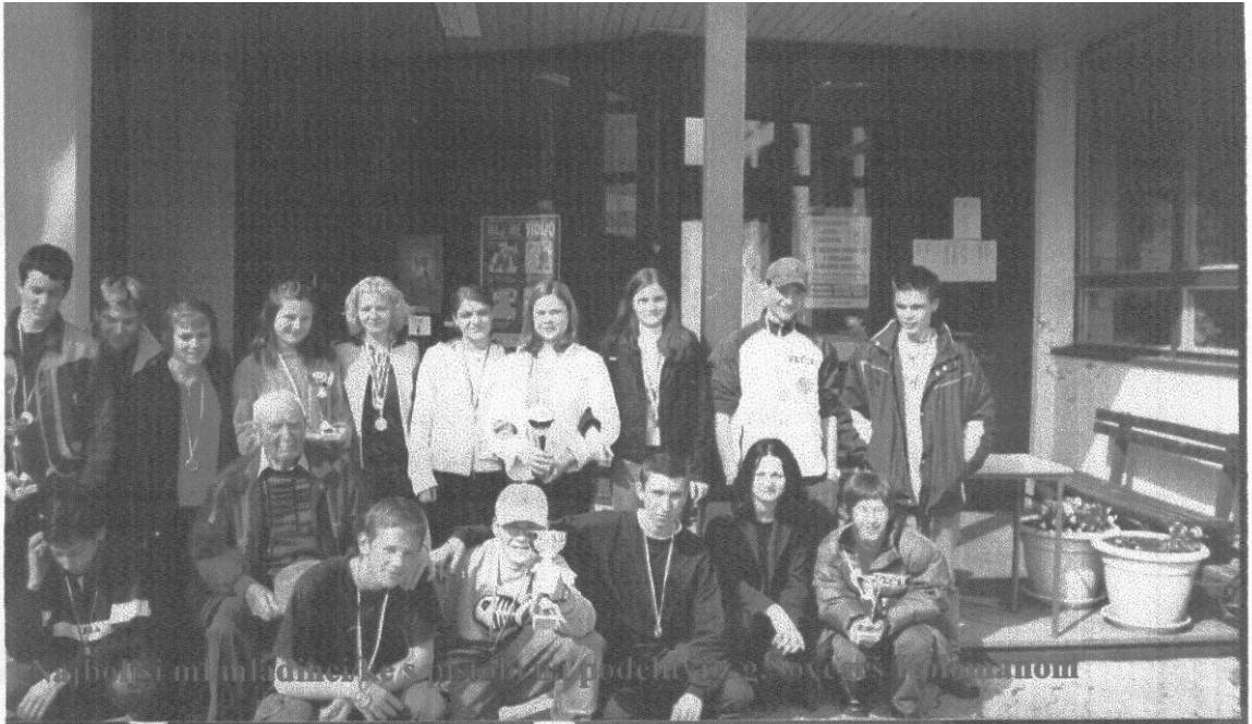
Na najboljši mladi članici, ki je nastala na področju telesa, se srečajo v našem