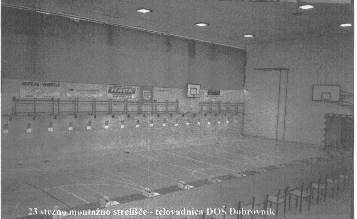
23 stežno montažno strelišče - telovadnica DOŠ Dobrovnik