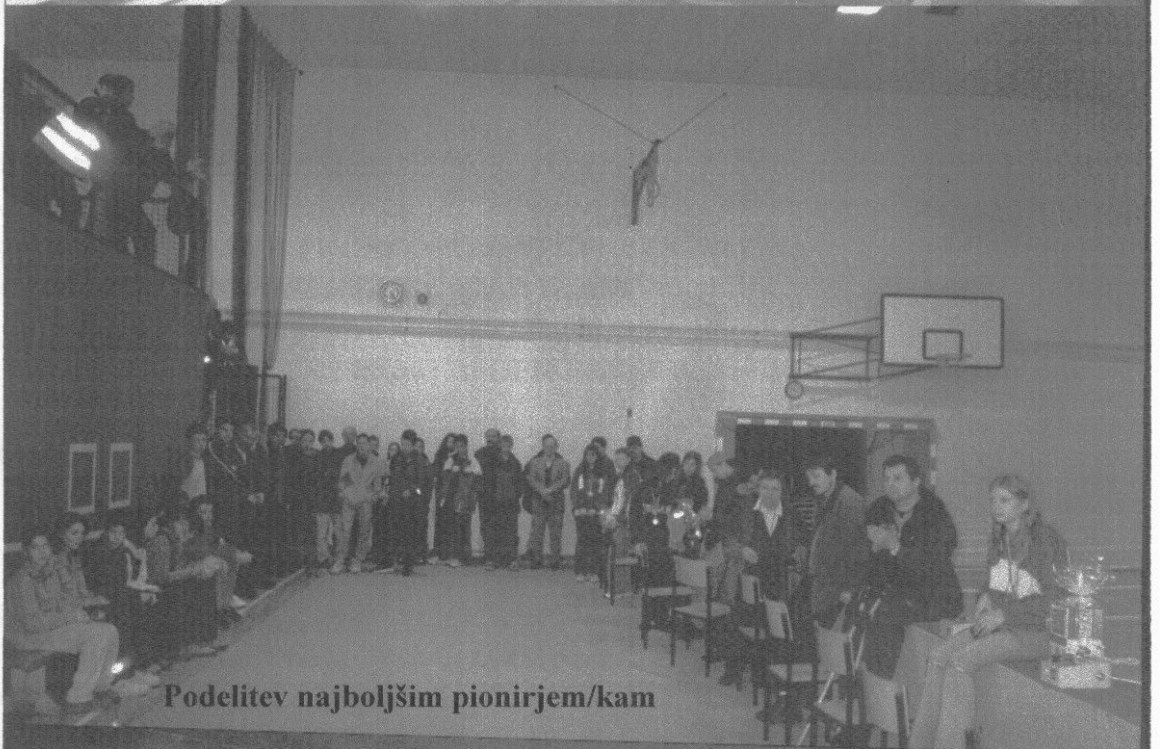
Podelitev najboljšim pionirjem/kam