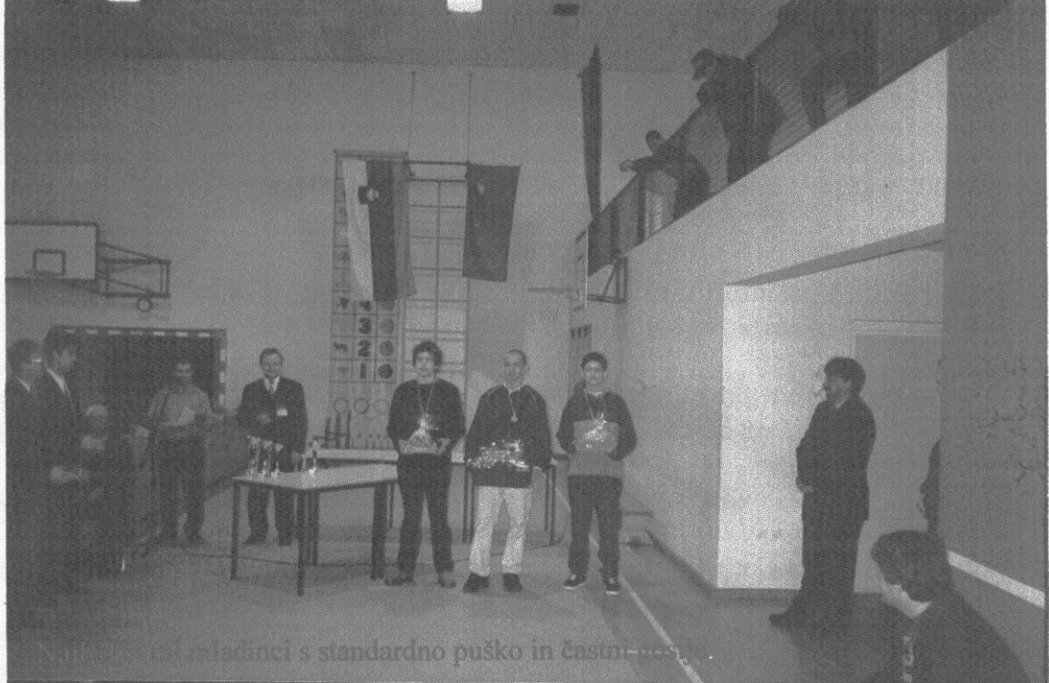
Najboljši mladi članici s standardno puško in častni povelje.